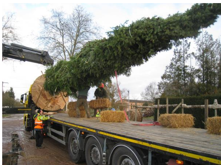
Grutage et chargement d'un PSEUDOTSUGA menziesii (douglasii)