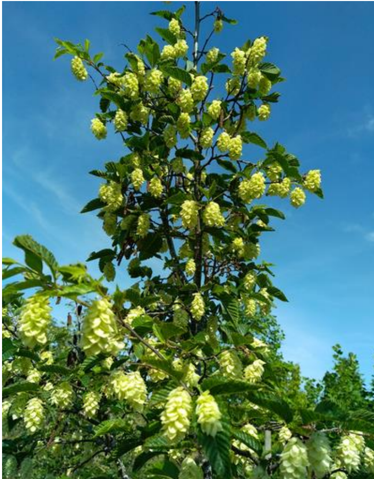
OSTRYA carpinifolia en fleurs