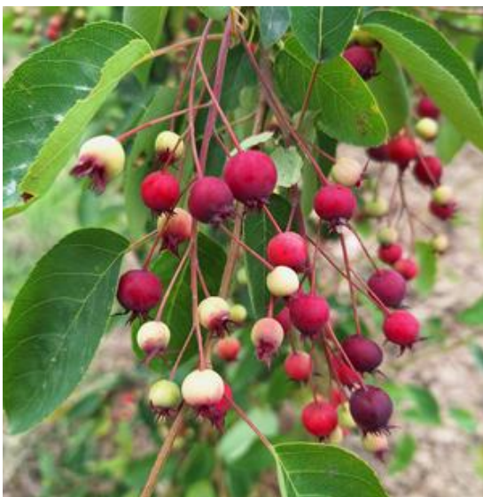
Fruits d'AMELANCHIER lamarckii