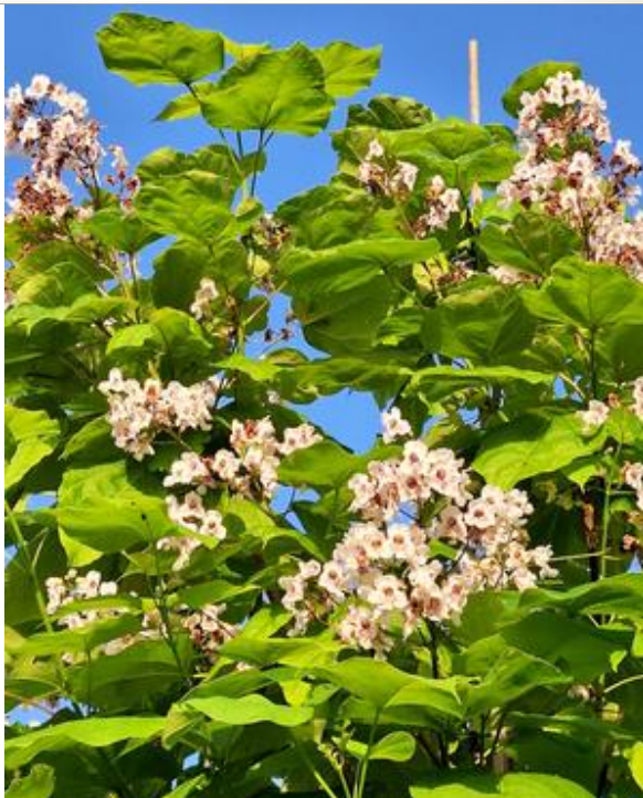
CATALPA bignonioides en fleurs