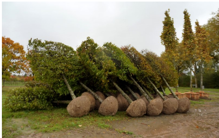
TILIA europaea 'Euchlora' palissés et PLATANUS acerifolia prêts pour le chargement.