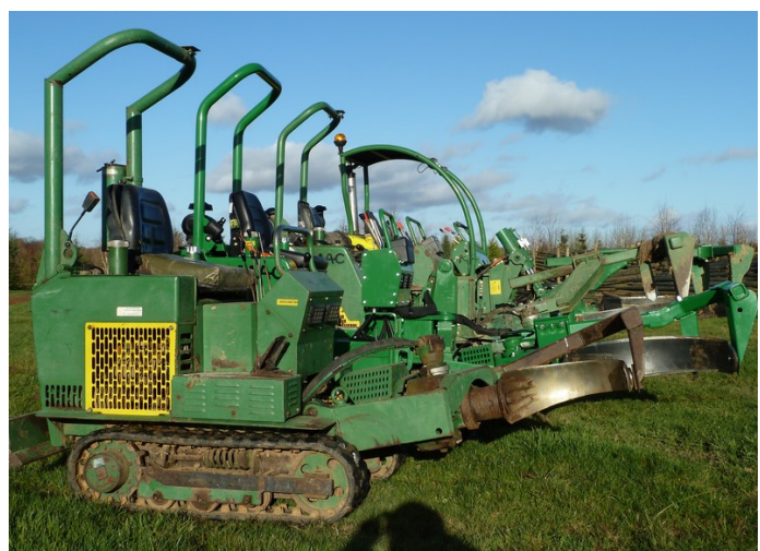
Holmac prêtes à reprendre leurs fonctions.