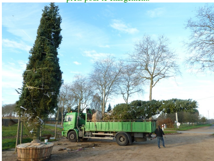
Camion Thuilleaux prêt à livrer.