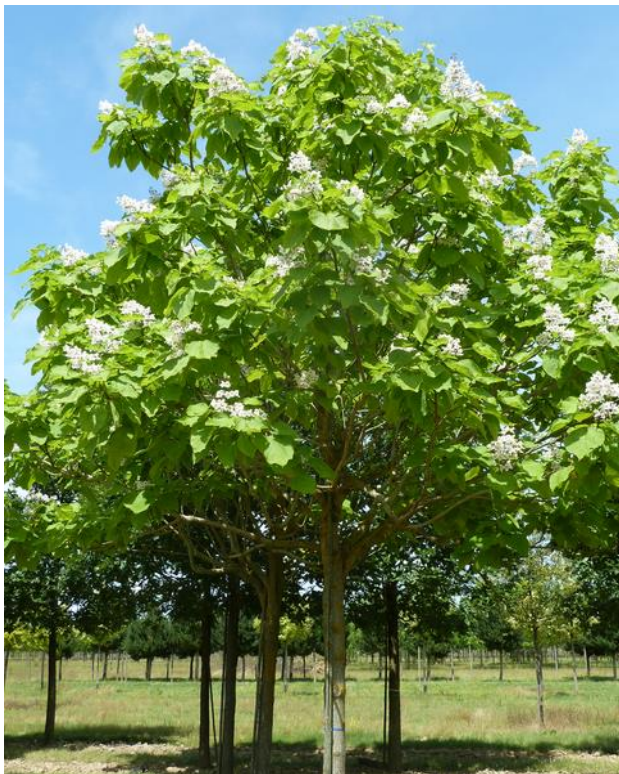
CATALPA bignonioides en fleurs