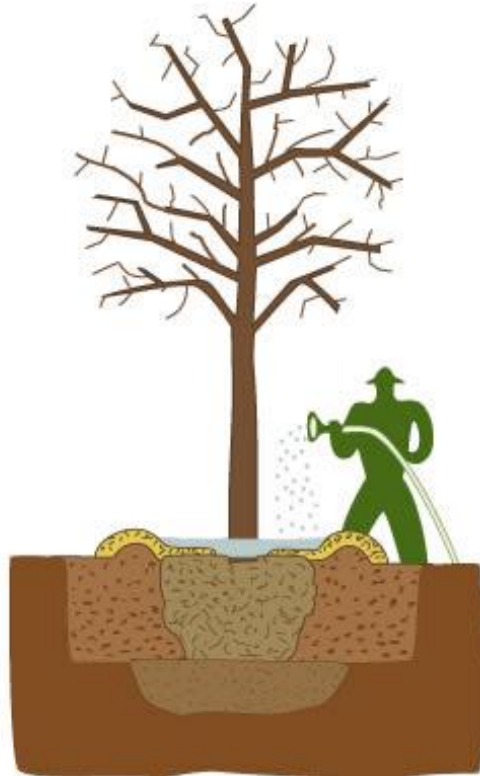
ARROSAGE PAR LA CUVETTE

D'abord on arrose 🌿 et ensuite on se repose! ☀