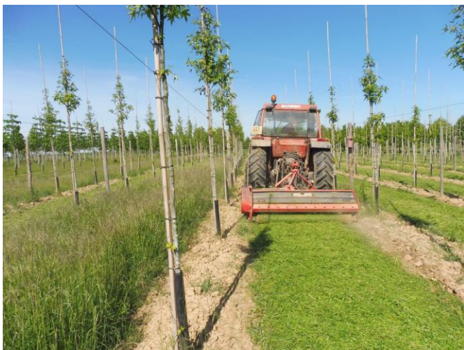
Broyage de bandes enherbées

Conception : Centre de transfert de technologie en foresterie (CERFO)