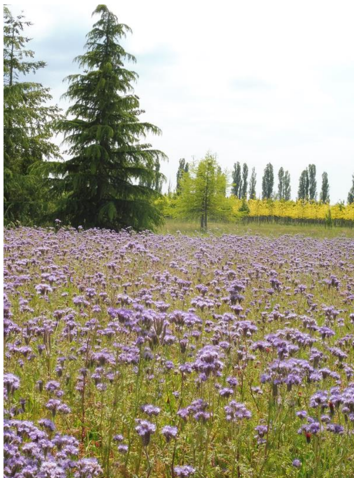
Jachère semée de Phacélie

Arroser les arbres plantés cette année et l'année dernière, tous les 10 à 15 jours selon les conditions météorologiques et la nature du sol. L'arrosage se fait à la cuvette. Il faut vérifier que celle-ci soit en bon état.