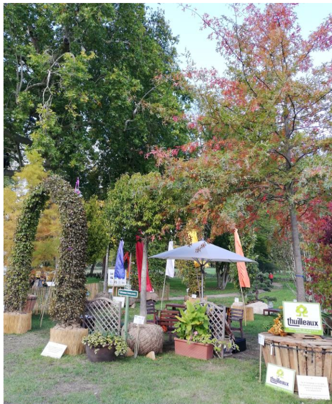
Notre stand aux Journées des Plantes de Chantilly