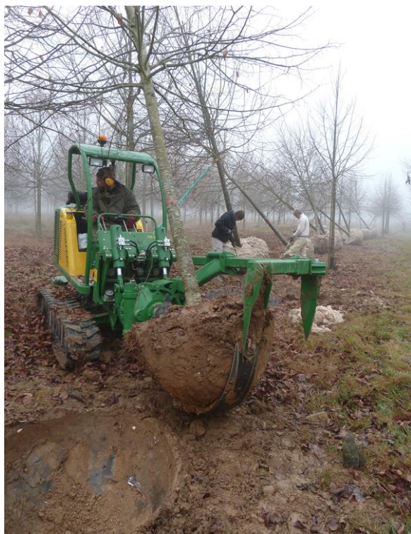
Confection d'une motte